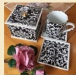
N and N