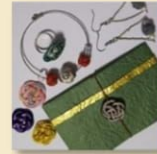
ハンドメイド 優舞