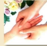
サロンド フルベール