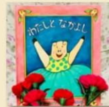
癒しの 絵本じかん