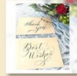
Tree and wind calligraphy