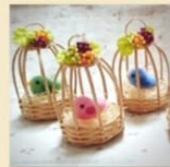
mugi & carrot