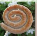
近藤 スワインポーク